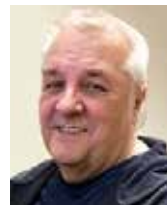
Renald Lessard Mise en pages

Ce numéro contient de nombreux changements. On voit bien que le nouvel éditeur y a ajouté ses couleurs, dont pour la première fois, la page couverture imprimée sur papier glacé. La mise en page renouvelée créera-t-elle un nouvel intérêt à lire les articles? Tous les commentaires reçus sont unanimes : le journal est très beau.