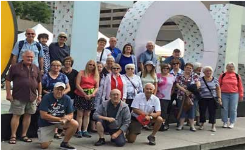
Escapade à Toronto et aux Chutes Niagara 18 au 21 août 2018