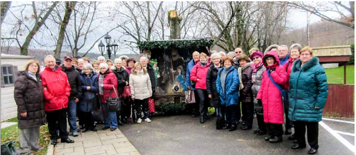
Noël en automne au Manoir du Lac William - 28 au 30 octobre 2018