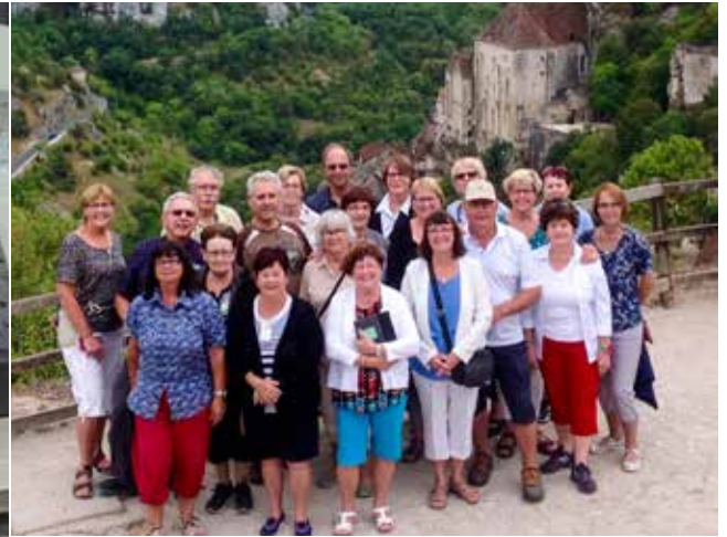
Les plus beaux villages de France 8 au 18 septembre 2018