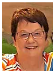
Louise Giroux Service des communications

Nous vous rappelons qu'en cas de difficulté, quelle qu'elle soit, pour vous connecter ou naviguer sur la plateforme informatique, vous pouvez demander de l'aide en complétant le formulaire identifié comme suit.