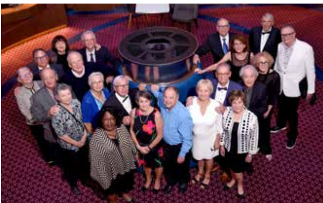
Croisière transatlantique "bridge" - 26 octobre au 11 novembre 2018 Nos voyageurs en tenue de Gala