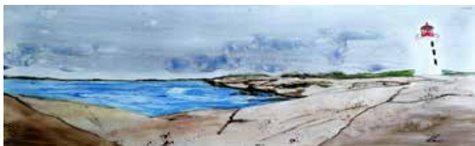
Peggy's Cove - aquarelle - Louise Giroux