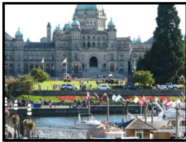
Escapade dans l'Ouest canadien

En plus d'offrir un beau choix de voyages, tout a été mis en place pour bien communiquer l'information et faciliter les inscriptions. Celles-ci se font en ligne à l'aide d'un formulaire qui se trouve sur le site WEB. En plus des voyages terrestres, nous proposons des croisières et certains voyages thématiques.