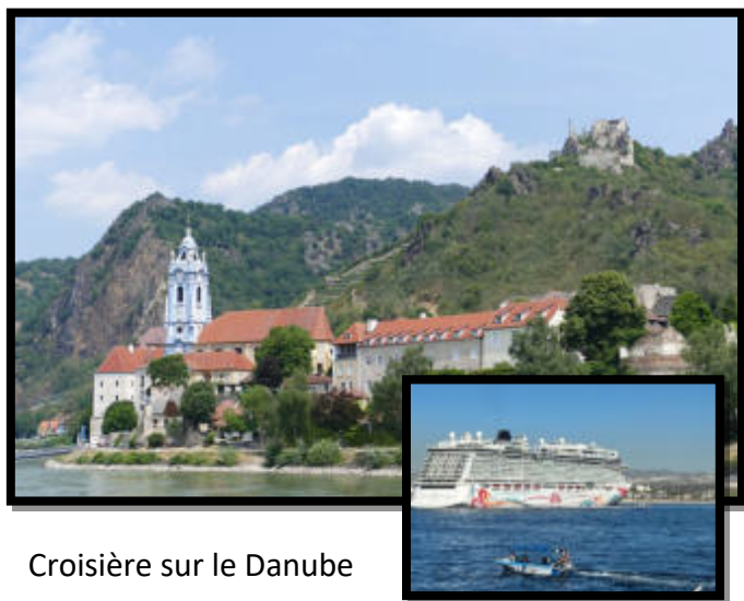
Croisière sur le Danube