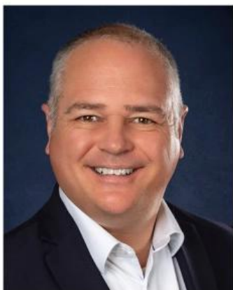
Jonatan Julien Député de Charlesbourg

Enfin, lors de nos activités, il y a occasionnellement prise de photos des participants. Celles-ci peuvent être diffusées sur le site WEB de la CJR, dans la section réservée aux membres.